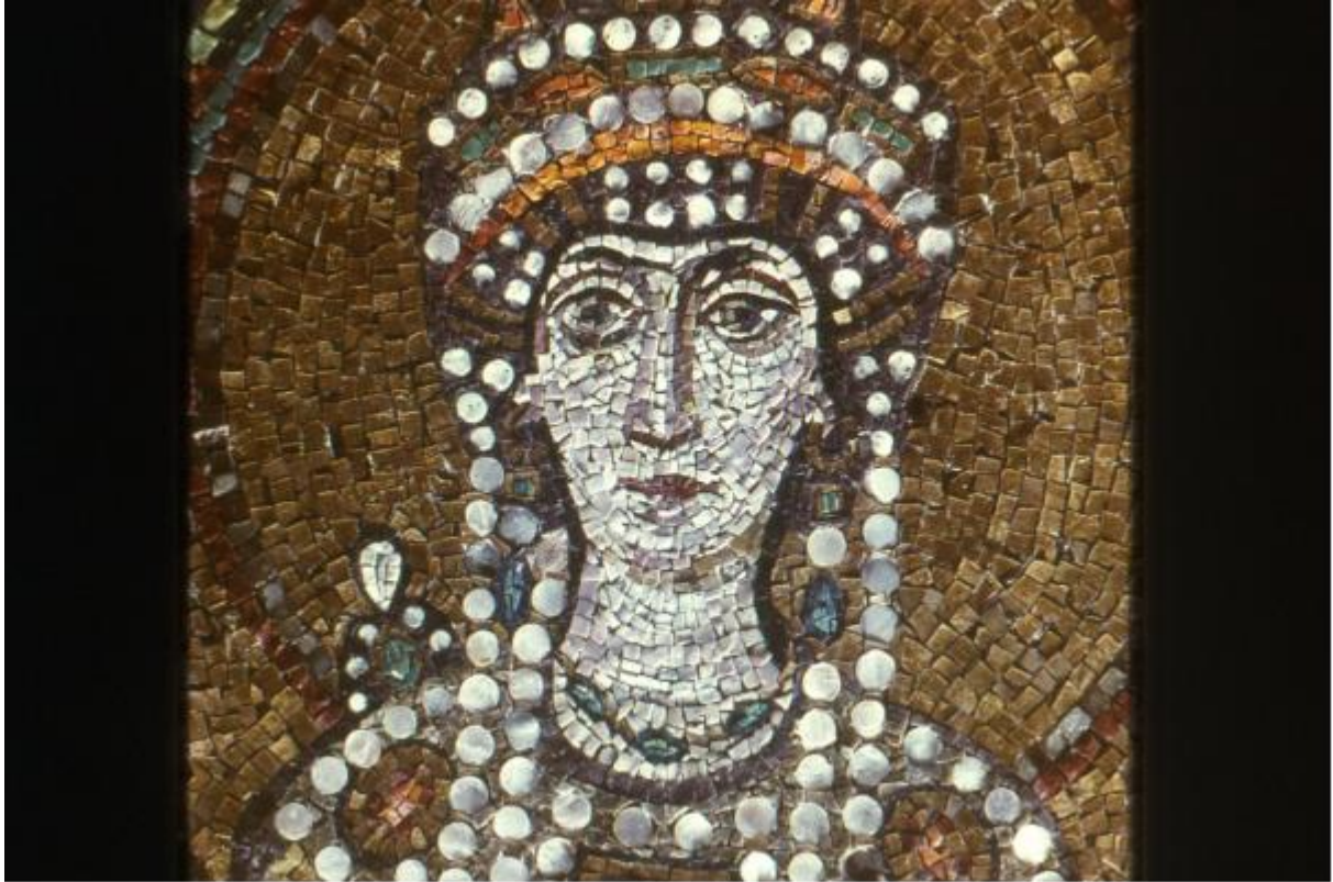
Portret van keizerin Theodora.

Justinianus draagt een gouden pateen in de handen en Theodora een met edelstenen ingelegde kelk.